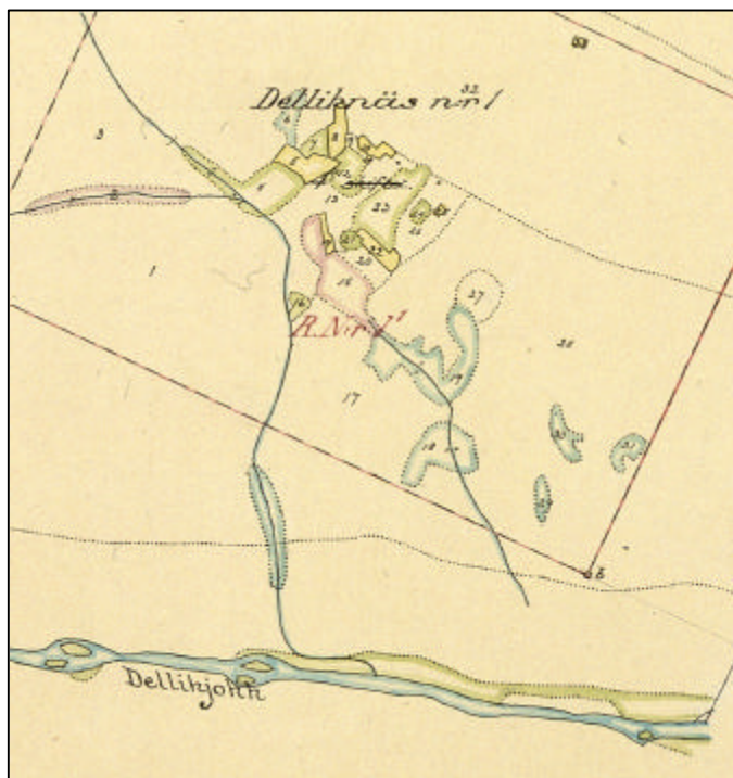
Figur 3: Utsnitt ur avvitringsakten från 1911, inägan samt de närmast belägna utängarna.

Det kartmaterial som i huvudsak utgjort underlag för inventering och analys av bebyggelseutvecklingen är en avvitringsakt från år 1911 i skala 1:20 000 framtagen av O.A. Bergström (figur 3).