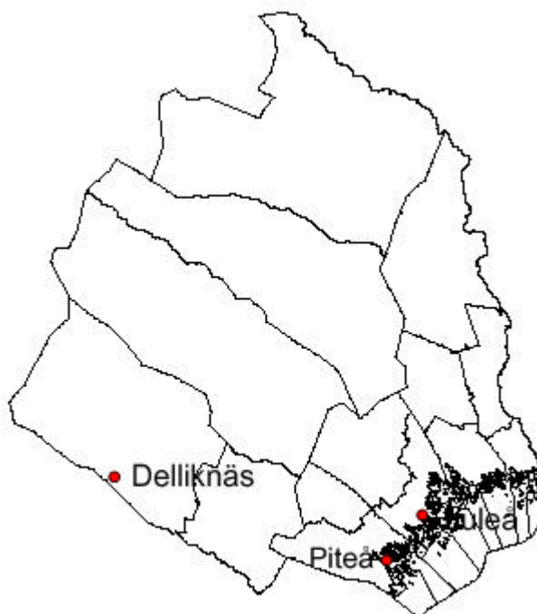
Figur 1. Norrbottens län med kommungränser. Delliknäs är rödmarkerat.

Fältarbetet och föreliggande rapport har utarbetats av Kerstin Lundin-Segerlund vid länsstyrelsen i Norrbottens län. Fältarbetet genomfördes 1999-06-14 – 1999-06-17. Den inventerade arealen uppgår till ca 30 hektar och sammanlagt har 2,5 dagar disponerats för inventeringen.