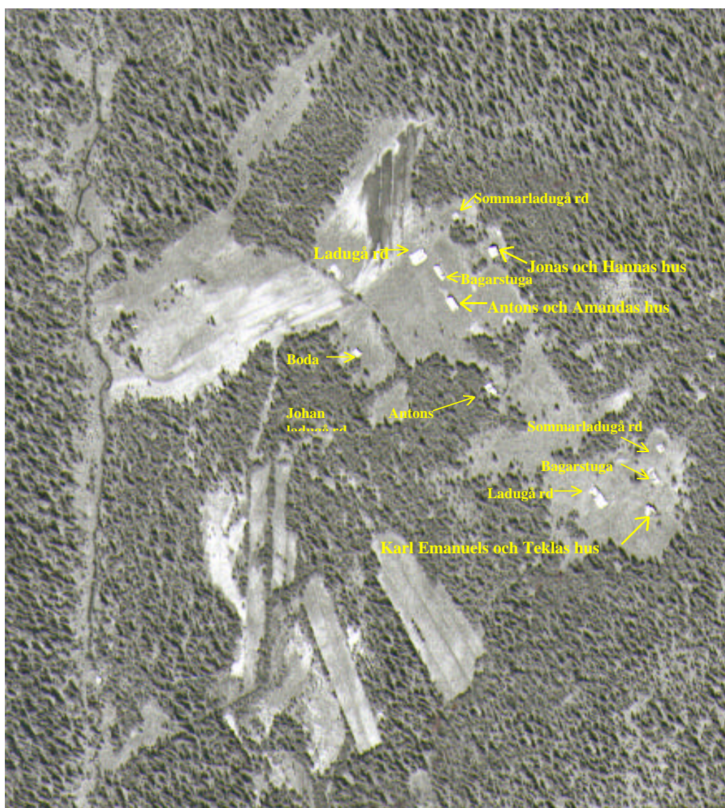
Figur 4: Utsnitt ur flygbild med de olika byggnaderna markerade

Närmast bebyggelsen bröts åkertegar för foder-, korn och potatisodling upp. Här fanns även flera sk. hårdvallsängar där naturligt gräsfoder togs tillvara. Utöver hårdvallsängarna kring själva nybygget fanns vid Torbäcken, samt vid både Dellikälven och Laisälven flera naturliga strandängar, sk sidvallsängar. Ända en mil upp efter Dellikälven hade man naturliga slåtterängar. Runt nybygget och vid Dellikälven nyttjades även myrar för slåtter. Ängsmarken gav 1911 drygt 17 lass hö. På slåtterängar, slåttermyrar och odlingar uppfördes lador och höet hässjades på trähässjor.