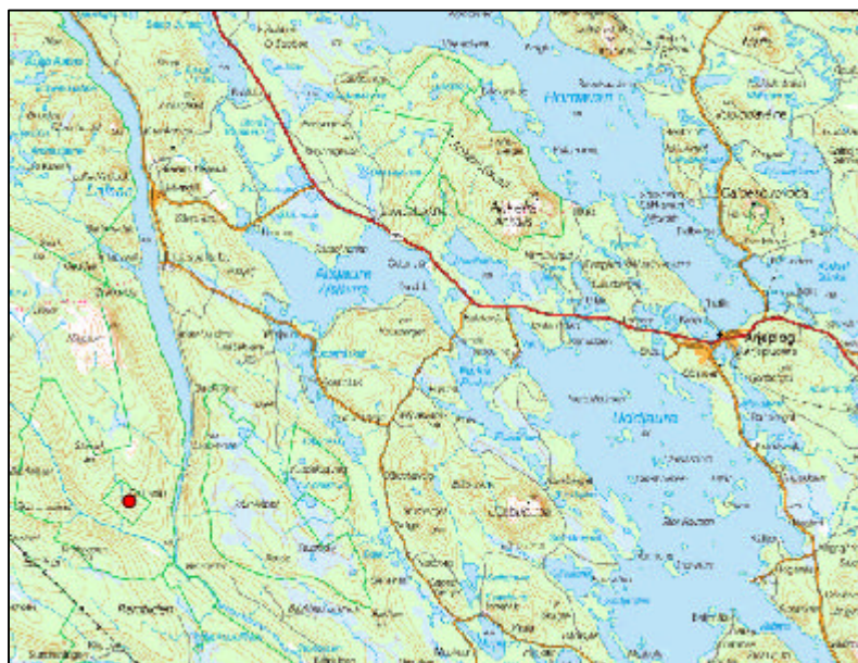
Figur 2: Visar ett utsnitt ur röda kartan, till höger syns Arjeplog, Delliknäs är markerad med en röd punkt i vänstra kanten.

Vegetationen består av barrskog av frisk ristyp, dvs. tall- och granskogar med inslag av lövträd, företrädesvis björkar, och ett bottenskikt av mossor, blåbär, lingon och kråkbär. Utmed älvarna, bäckar och myrmarker växer frodig örtvegetation (Vegetationskarta 1992).